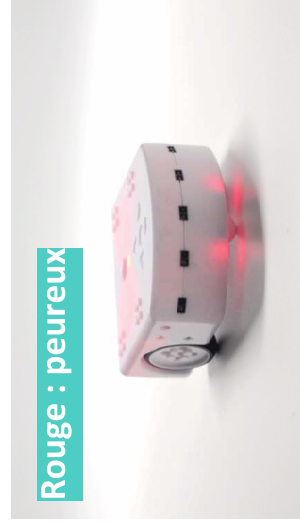
Rouge : peureux

En bleu foncé, Thymio réagit au son. On peut commander le robot avec des clappements de main. 1 clap > il tourne ou avance tout droit. 2 claps > marche / arrêt. 3 claps > il fait un cercle