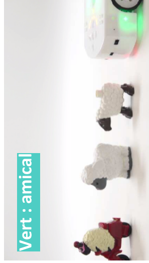
Vert : amical

En bleu clair, Thymio suit une piste. La piste doit être au minimum de 4cm de large et avoir un contraste élevé (idéal en noir sur blanc).