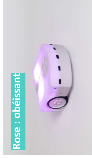
Rose : obéissant

En rouge, Thymio fait du bruit quand on le touche, il nous fuit et sonne l'alarme quand il est coincé. Il sait quand il est en l'air et montre la direction de la gravité avec ses LED du dessus