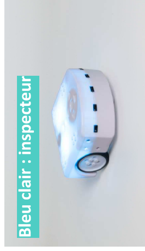
Bleu clair : inspecteur

En jaune, Thymio explore doucement le monde tout en évitant les obstacles.