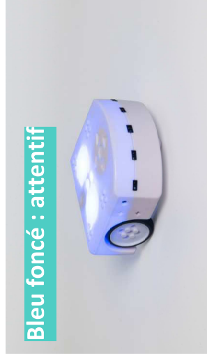
Bleu foncé : attentif

En vert, Thymio est amical. Il peut suivre une main ou un objet à une certaine distance. Si on s'approche trop, il reculera. Il s'arrête quand il est dans le vide.